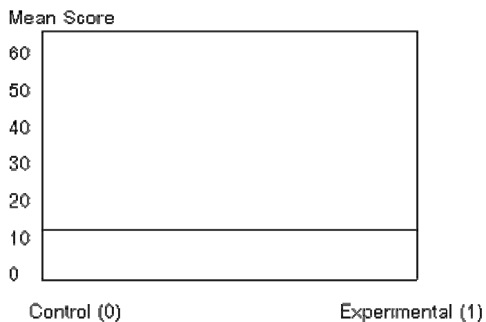
ภาพประกอบ 1 ผลการทดลองครั้งที่ 1